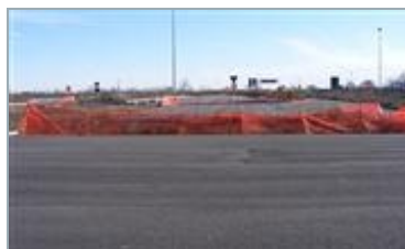
SANTHIA' (VC) Autostrada A26 dei trafori / A.d.S. "Cavour Est"